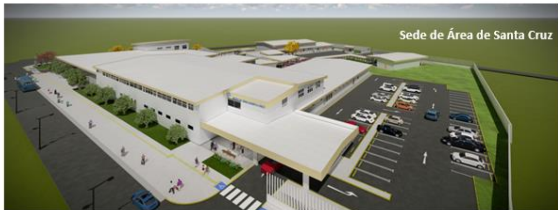
Sede de Área de Santa Cruz

Proyecto EDUS Hospital de Puntarenas Hospital Turrialba Salas de Operaciones, Sala de Partos y UCI Hospital México