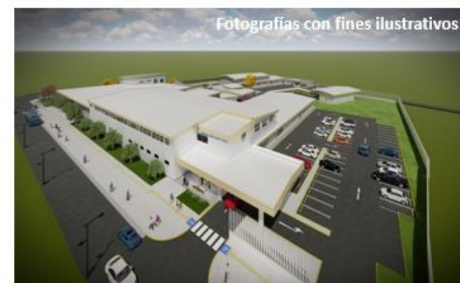
Fotografías con fines ilustrativos