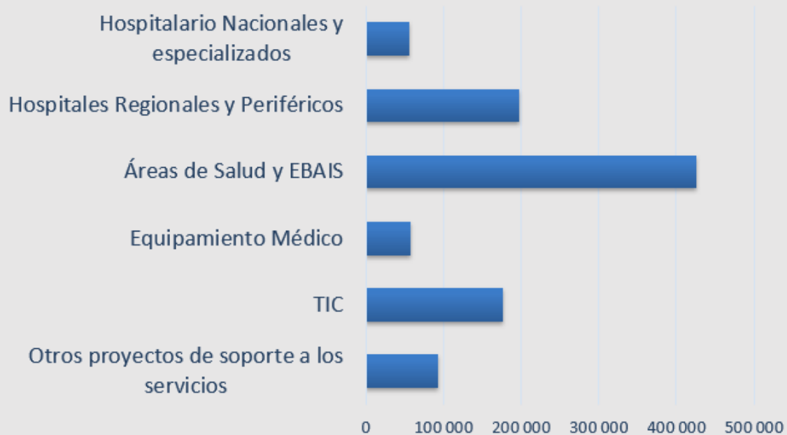
CCSS: Destino de los recursos Millones de colones