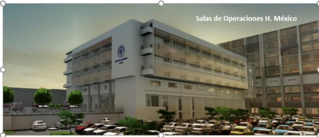
Salas de Operaciones H. México

Proyecto EDUS Hospital de Puntarenas Hospital Turrialba Salas de Operaciones, Sala de Partos y UCI Hospital México