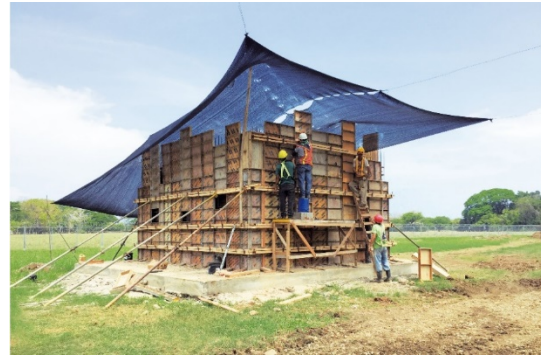
Ario - Mal País