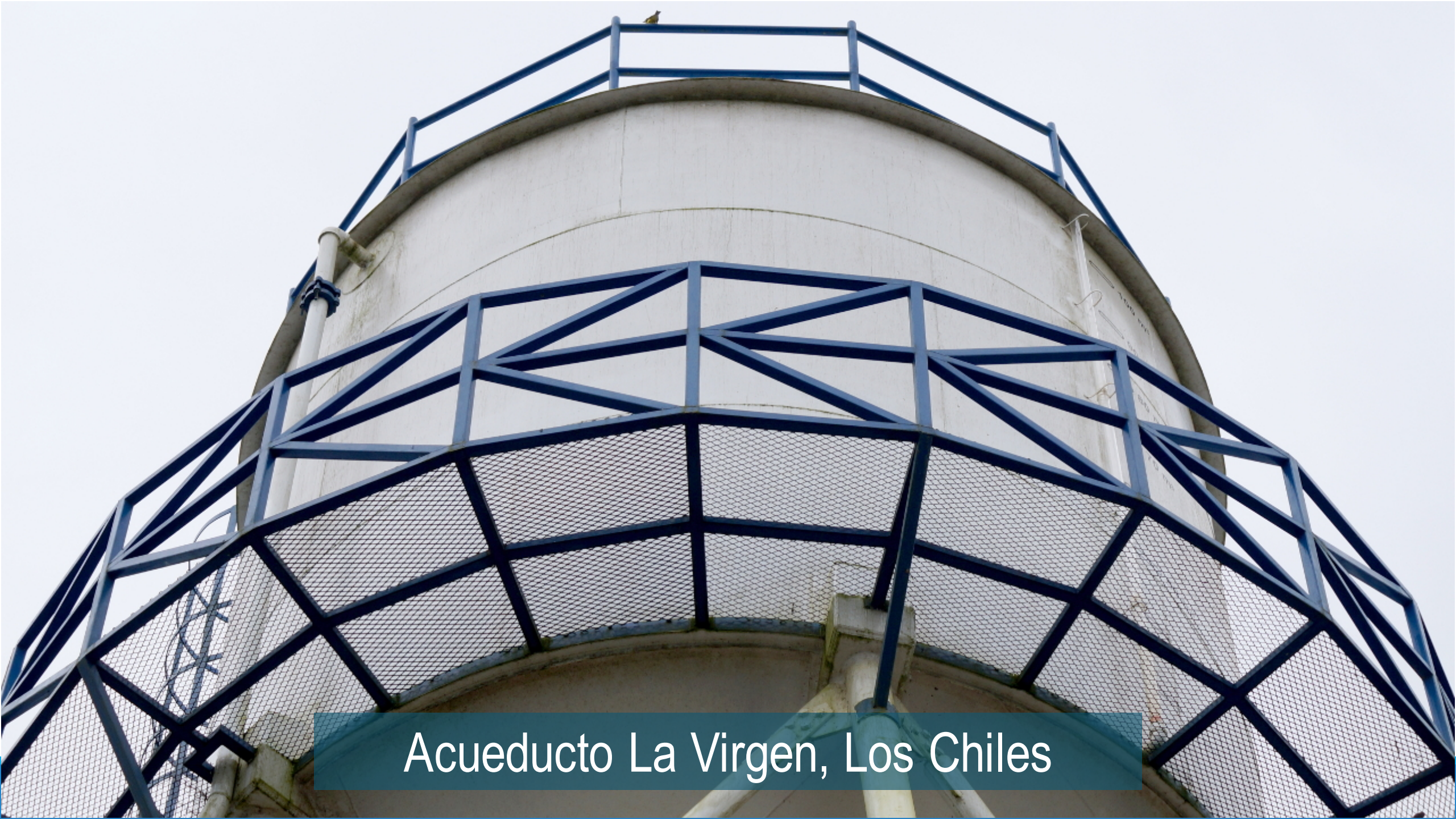
Acueducto La Virgen, Los Chiles