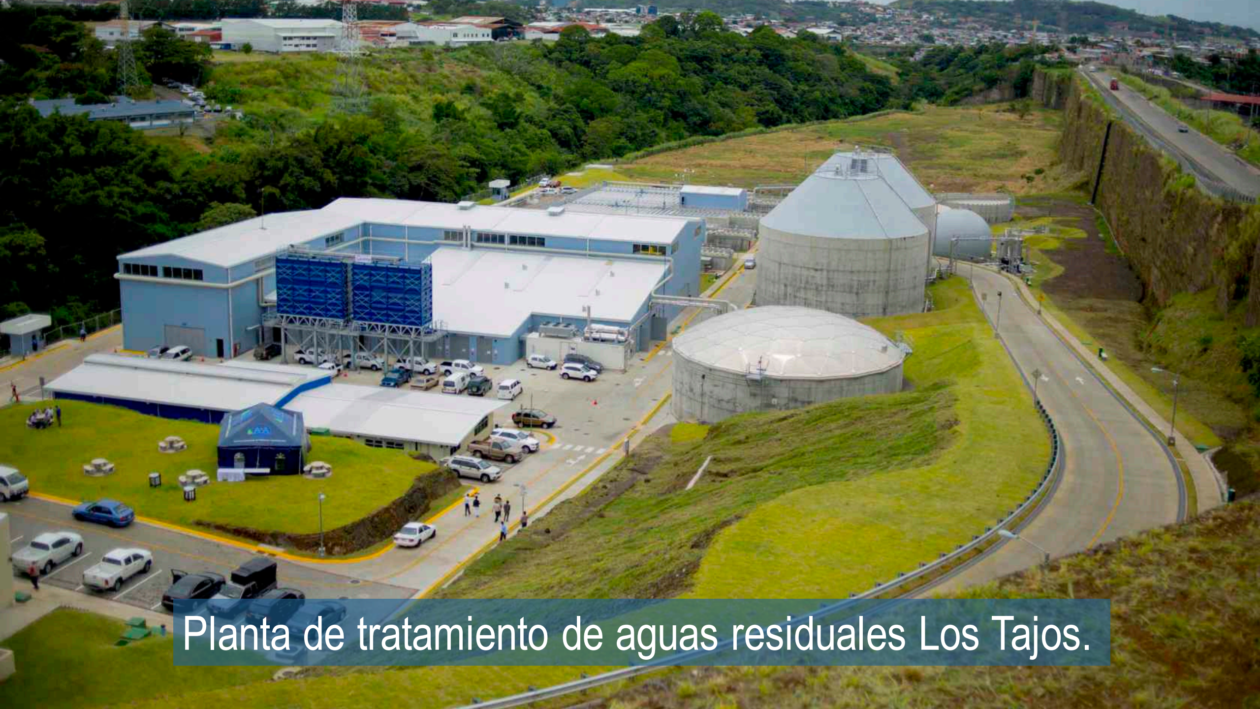
Planta de tratamiento de aguas residuales Los Tajos.