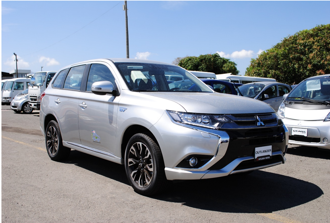
20 MITSUBISHI OUTLANDER híbridos - eléctricos (2018)