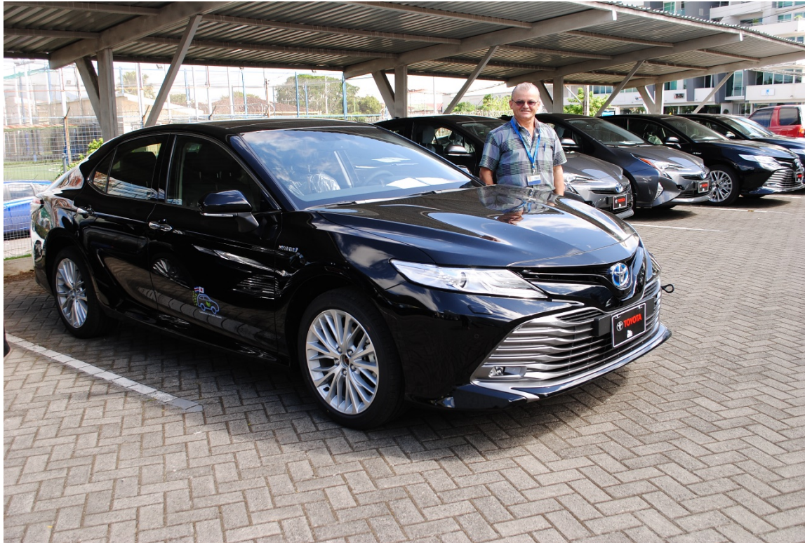
6 TOYOTA CAMRY híbridos (2018)