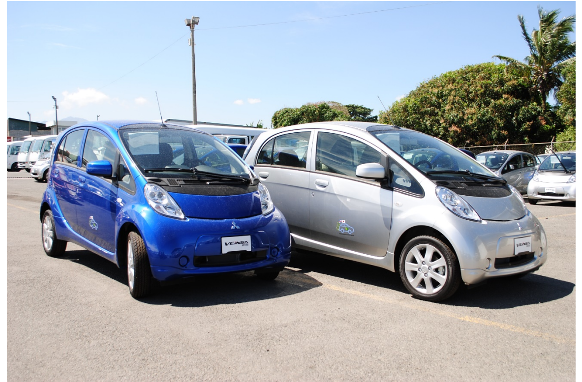
29 MITSUBISHI i-MiEV eléctricos (2017.5)