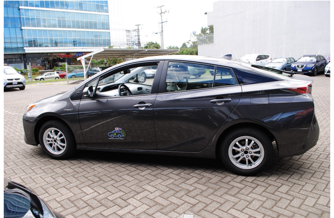
5 TOYOTA PRIUS híbridos (2018)