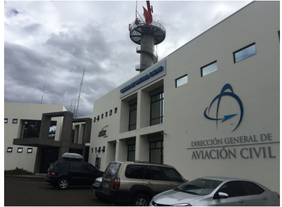
Nuevo Centro control de Radar