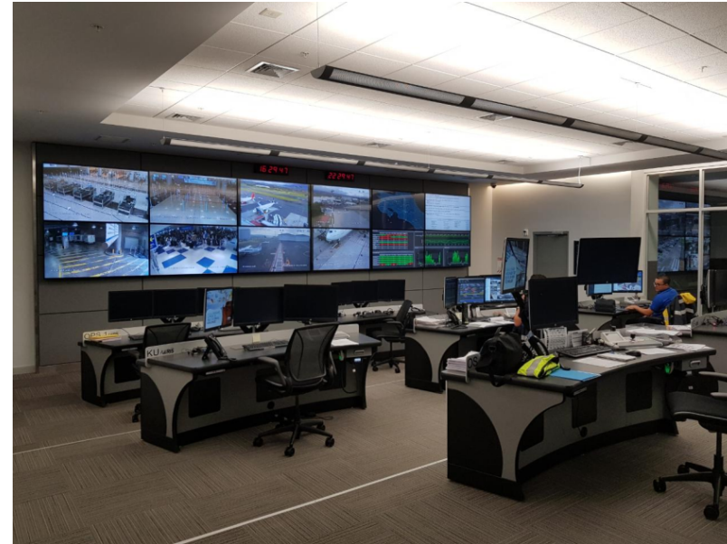
Centro de Operaciones y Comunicaciones